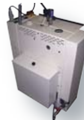
Générateur avec bache (option)