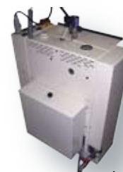
Générateur avec bache (option)